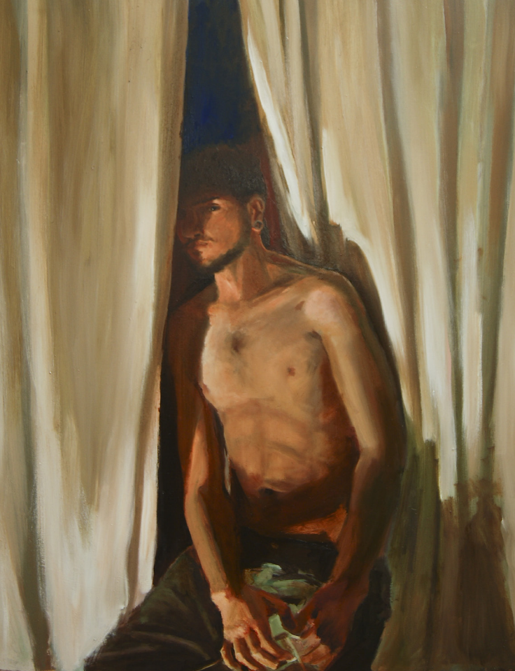
Album bianco , olio su tela, 140x100 cm.