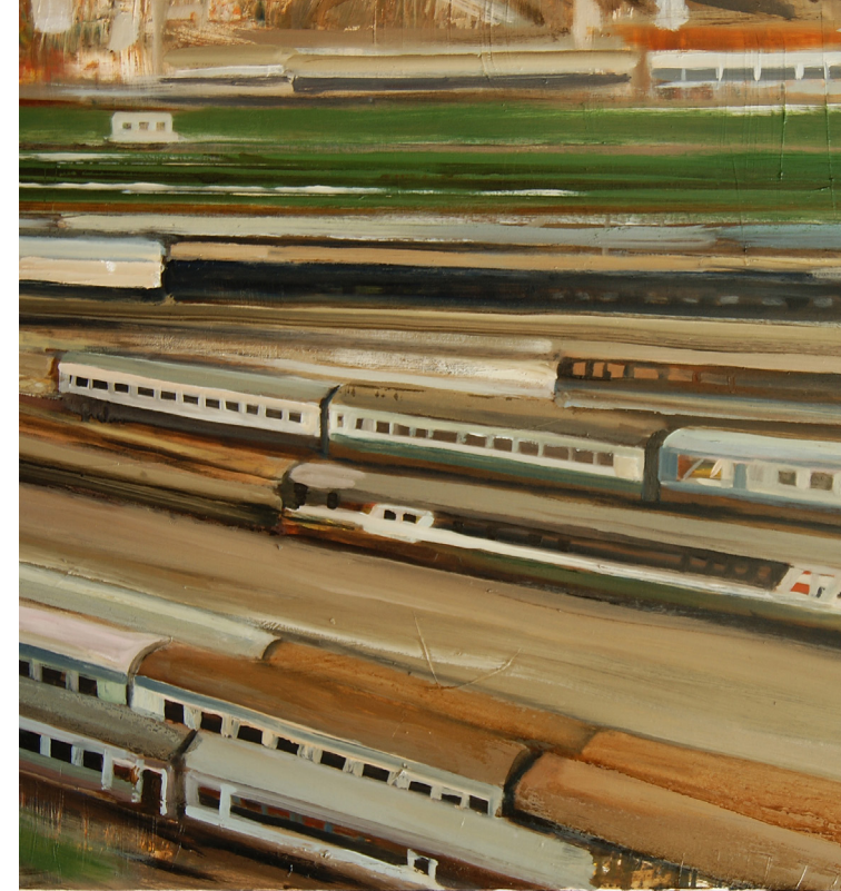
Treni , olio su tela, 60x80 cm.